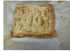
アップルパイ 金デイお菓子