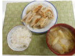
ぎょうざ定食 Hさん