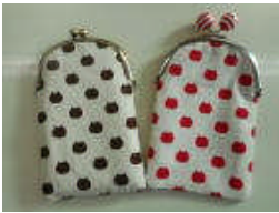
スマホケース Kさんたち