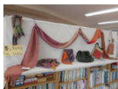
2月のギャラリー 春のさきがけ 巻島猛展