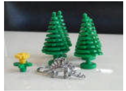
Gさん 恐竜のキーホルダーを 使ったジオラマ