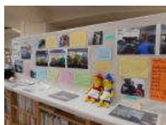
3月のギャラリー 『人形劇団』ろばのひまな日 20年の歩み