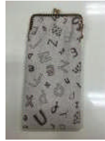
Aさん手作り スマホケース