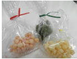
Sさん おもちで作った ひなあられ