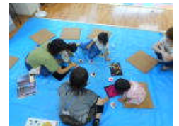
ちびっこあーとぼっくす