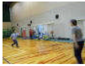
7/14 金デイ 国立でスポーツ