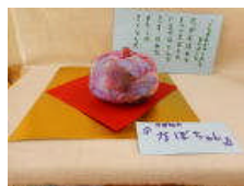
かぼちゃの『かぼちゃん』