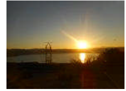
諏訪・松本の風景