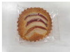
金デイ 紅玉りんごのケーキ