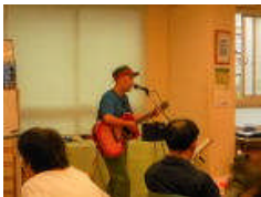
10月のギャラリーとライブ