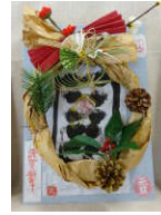
12/29 ウィンタープログラム お正月飾り