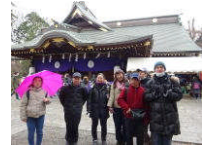
1/12 青年の会 初詣