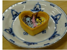
2/9 オリジナルチョコ