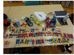
Tさんの宝物 ヒーロー大集合