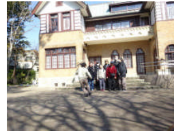
2/23 山本有三記念館で