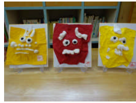
ちびっこあーとぼっくすの作品