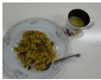
Kさん ドライカレー