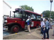
レトロなミニバス