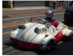
たまたま通りかかったカート。 ドラえもののマスクでした。