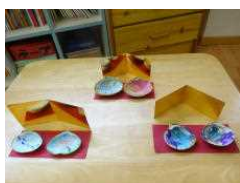
2/25 ちびっこあーとほくす