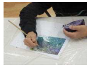
ちびっこあーとぼっくすの作品