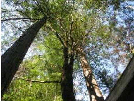
(ヒノキともみじとサウラ)