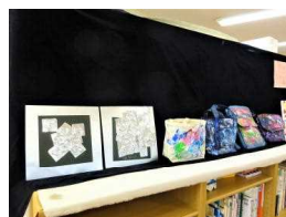
3月のアート作品たち