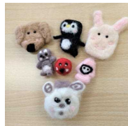
「羊毛フェルトの動物たち」