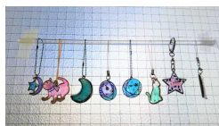
「レジンのストラップ」